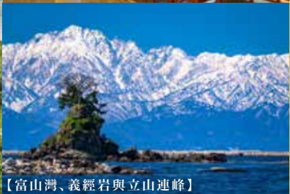
【富山灣、義經岩與立山連峰】