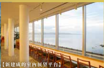
【新建成的室內展望平台】