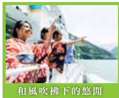
和風吹拂下的悠閒

這首祈求及慶祝五穀豐穰的純樸民謠民舞需由男性身穿直垂、括袴、綾筒笠靈活豪邁地打響Sasara並一邊跳著「Sasara舞」，而女性則是在額頭綁上頭飾，手持兩邊綁上的紙垂，優雅地跳著「垂舞」。