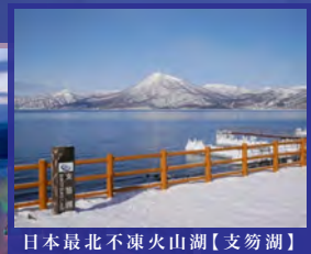
日本最北不凍火山湖【支笏湖】

【2月20日出發增遊】場館內林立的冰雕全都由匠人將透明度數一數二的支笏湖湖水噴射並冷凍製作而成。冰制的滑梯、穿長靴即可滑行的滑冰場、騎馬環遊會場的騎游體驗等。