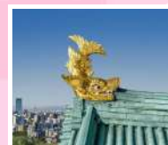
天守閣屋頂的金鯱

牧歌之里位於岐阜縣奧美濃地域的主題公園，繁花似錦。一年四季都有鮮花盛開，5月上旬至中旬賞鬱金香；5月下旬至6月中旬賞罌粟花；6月賞百合、芍藥等，園內有小火車可快速遊覽公園。