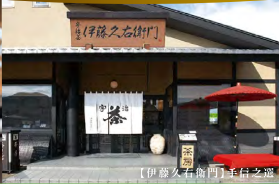
【伊藤久右衛門】手信之選