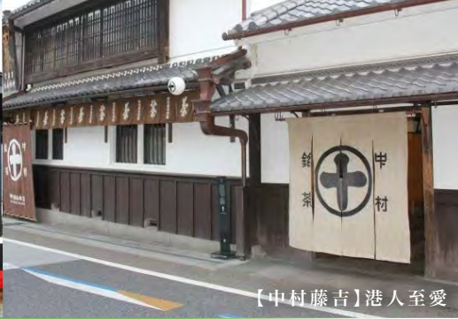
【中村藤吉】港人至愛