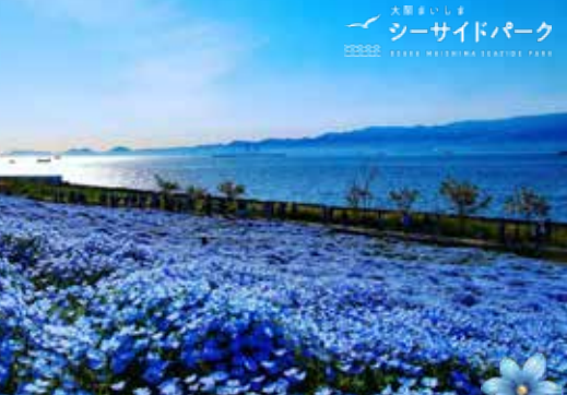
大阪舞洲シーサイドパーク OSAKA MAISONNAISE SEASIDE PARK

一處遠離商業繁囂，仍保有自然美景，一年四季風景宜人的地方，渡月橋跨越嵐山腳下流過的保津川。可自由前往竹林小路感受被兩旁宏偉的竹林所散發出的幽靜氣息，2019年獲美國CNN選入日本36景之一。另外，亦可散步到世界文化遺產的天龍寺外苑，感受嵐山的靈氣與古韻風情。