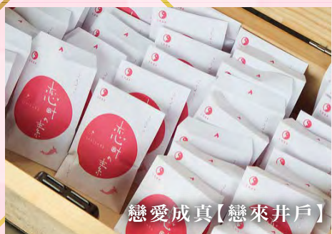
戀愛成真【戀來井戶】