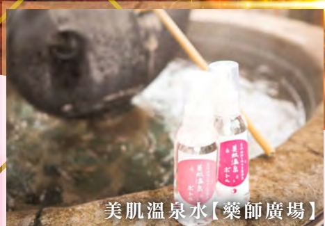
美肌溫泉水【藥師廣場】