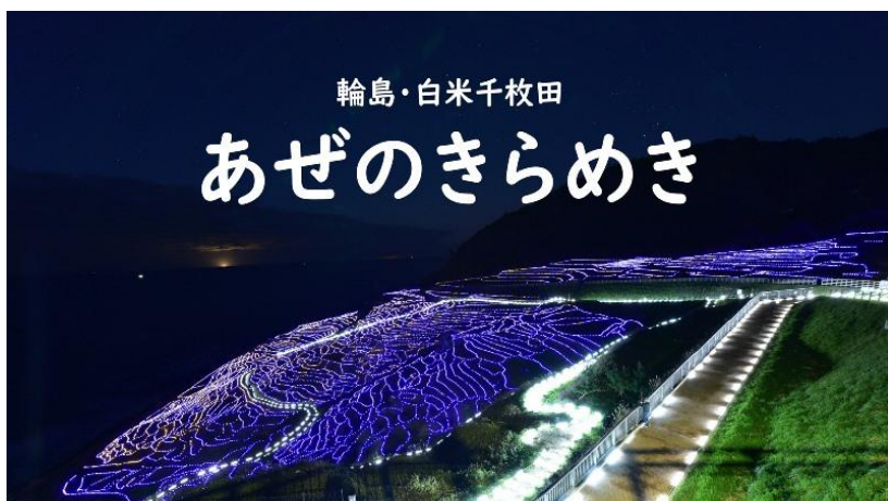
輪島・白米千枚田

每年在 10 月中旬到 3 月中旬期間，舉行大規模的霓虹彩燈活動叫【畔之光】。在梯田邊設有 25,000 個太陽能 LED 燈。日落後，LED 彩燈會每隔 30 分鐘就會出現不同的顏色，眼前粉色的彩燈，瞬間換成黃色，讓您仿如置身於幻彩世界中。