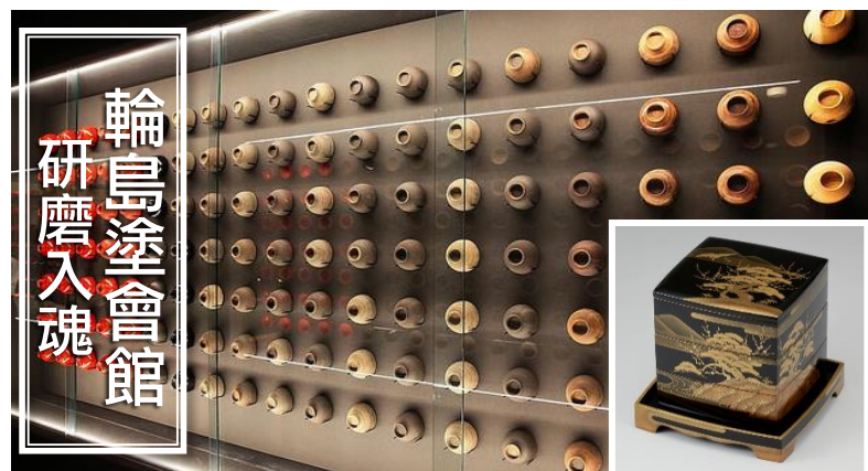
輪島塗會館 研磨入魂