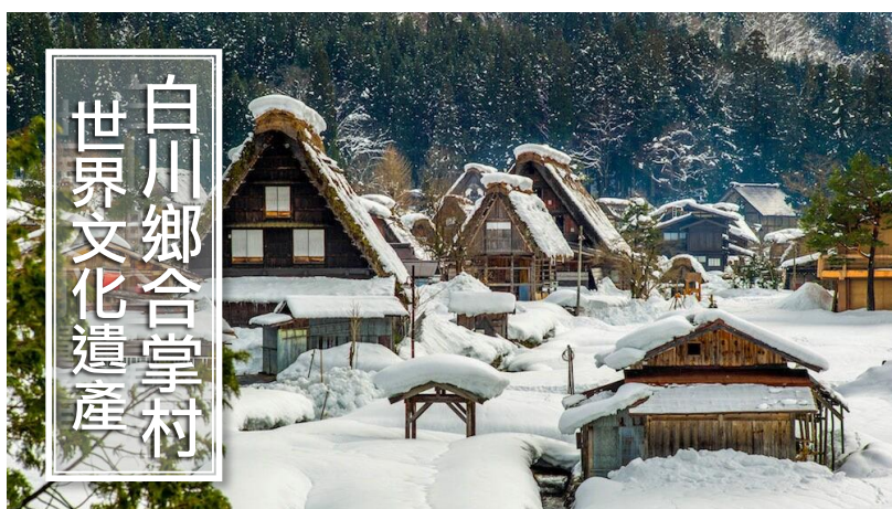
白川鄉合掌村 世界文化遺產