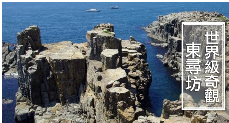
世界級奇觀 東尋坊

東尋坊的岩石是輝石安山岩的柱狀節理（五角形或六角形的柱狀岩塊）的岩柱，不僅在日本，就是在世界上也非常珍稀，全世界只有三處可以見到這種岩柱。當波濤洶湧的巨浪拍打千仞峭壁時景象磅礴，雄偉壯觀，非常的具有震撼力。