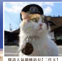
探訪人氣貓咪站長【二代玉】

【12月11日至2月29日出發前往】位於六甲山的 SNOW PARK 是人工雪場，除滑雪道外，特設玩雪專區，不怕與滑雪客相撞，盡情地堆雪人、打雪仗、玩雪橇。雪地有一定的斜度，大人玩雪橇亦可玩時不亦樂乎，更可與小朋友同坐雪兜，在銀白色大地上盡情享受雪地體驗。若想滑雪，亦可自費租借滑雪用具：雪靴、雪板、滑雪杖一套(約2900日圓)或雪靴、雪板、滑雪杖、滑雪襪、滑雪褲、手套一套(約4700日圓)，一展身手。