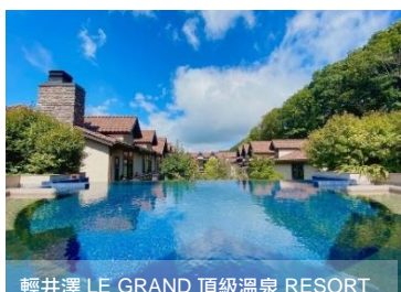
輕井沢 LE GRAND 頂級溫泉 RESORT