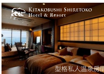
型格私人溫泉房間