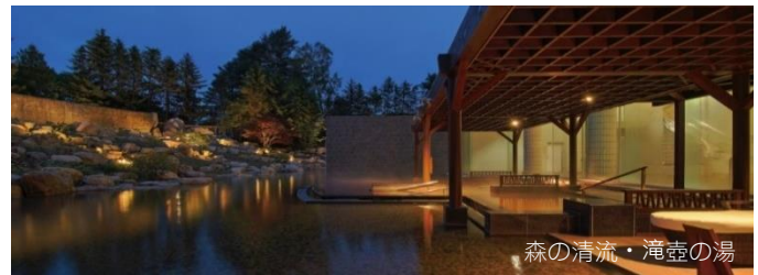
森の清流・滝壺の湯