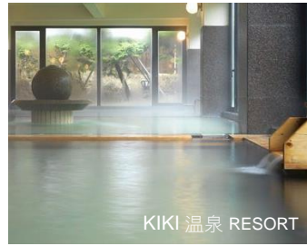
KIKI 溫泉 RESORT

酒店位於世界自然遺產知床半島，坐擁壯麗的鄂霍次克海及宇登呂港美景，讓您能完全感受到知床的原始的海陸景色。在欣賞完知床的美麗大自然後，大可享受溫泉放鬆身心。溫泉泉質為氯化鈉/碳酸氫鈉泉，溫度為 45~63 度。據說它對神經痛、肌肉痛和肩膀僵硬有效。而酒店餐食同樣充滿知床特色。早晚餐均以當地時令食材為主，新鮮美味。品嚐當地美食，滿足味蕾的享受，為世產知床之旅留下舌尖上的美食回憶。 www.shiretoko.co.jp / www.kikishiretoko.co.jp/