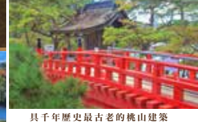
具千年歷史最古老的桃山建築