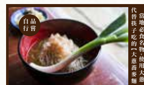
當地必食名物(使用大蔥代替筷子吃的「大蔥蕎麥麵」)

與京都的美山和白川鄉的合掌村齊名，被譽為日本三大茅草屋聚落。可自行品嚐當地必食名物-使用大蔥代替筷子吃的「大蔥蕎麥麵」、傳統爐烤岩魚、鄉土料理醬油芋餅等美食。