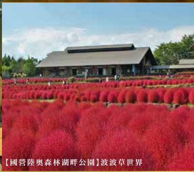
【國營陸奧森林湖畔公園】波波草世界