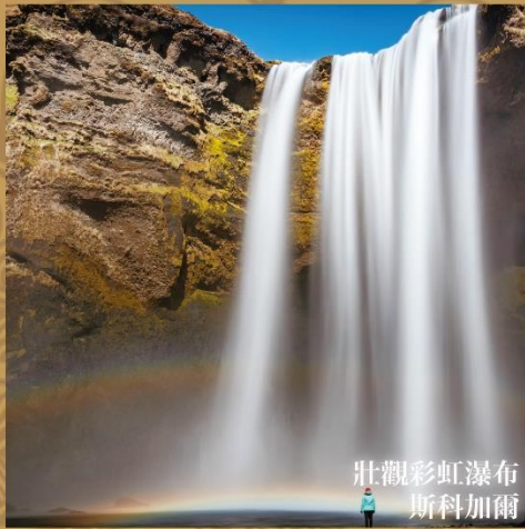
壯觀彩虹瀑布 斯科加爾