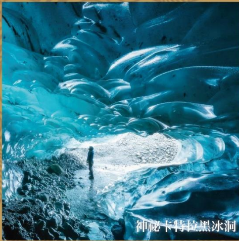
神祕卡特拉黑冰洞