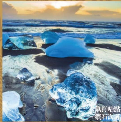
氣打咕點 鑽石海灘