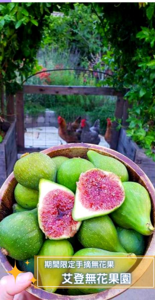
期間限定手摘無花果 艾登無花果園