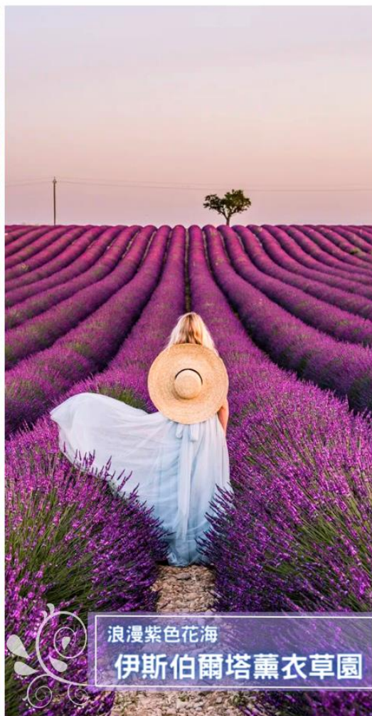
浪漫紫色花海 伊斯伯爾塔薰衣草園