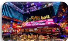
東急 KABUKICHO TOWER