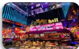
東急 KABUKICHO TOWER