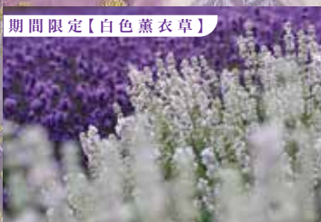
期間限定【白色薰衣草】