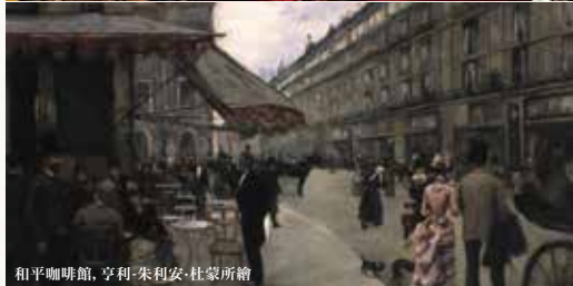
和平咖啡館, 亨利·朱利安·杜蒙所繪