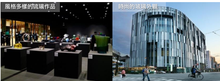
風格多樣的琉璃作品

享有「日本(及世界)最美星巴克」(2008)的美譽。店鋪外形採用結構簡單的方形設計，由三面巨大的落地窗戶以及戶外甲板組成。屹立在運河岸邊綠油油的草坪上，乍看之下宛如晶瑩剔透水上帆船。坐在店內邊吃點心、便喝咖啡，欣賞迷人的運河風光，在暖融融陽光的沐浴下，度過一個悠閒、舒適的下午。而星巴克與周遭自然景色完美融合，有機會能於店內一邊喝咖啡，一邊欣賞秋天美麗的楓葉。