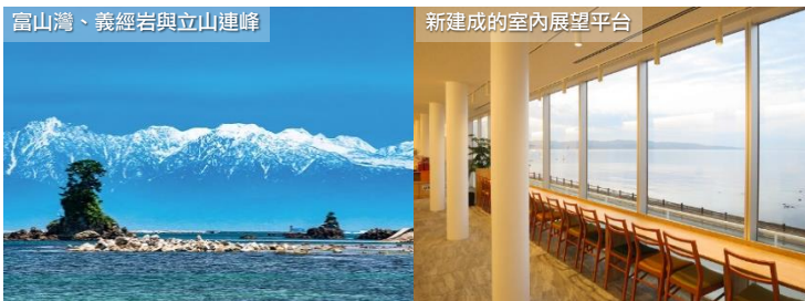
富山灣、義經岩與立山連峰

新湊漁港和一般的魚市場於早上拍賣不同，於下午 1 點開始進行午間的拍賣。由於流入富山灣的水都來自庄川峽、小矢部川、白山山系和飛驒山，當中含有多種礦物的礦水也都充分地注入到新湊的海裡。因此新湊的魚介類能夠獲得充分的營養成長。除了能觀摩到拍賣現場外，還能以令人難以置信的價錢享用新鮮的白蝦、松葉蟹、螢光烏賊、鰯魚、貝類等等，蟹類還會有專人填忙拆解。