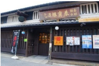
春鹿釀造元 設有日式酒吧的知名日本酒老舖