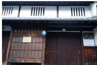
奈良町格子之家 欣賞傳統奈良木造老房子