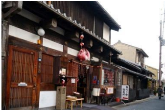
奈良町資料館 可購買此處僅有的奈良土產「替身猿」