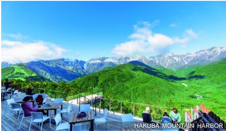
HAKUBA MOUNTAIN HARBOR

在充滿神聖象徵的白馬三山(白馬岳、杓子岳、白馬鍾ヶ岳)正對面，一個名為「HAKUBA MOUNTAIN HARBOR」的綜合商業設施落戶在白馬岩岳之上。