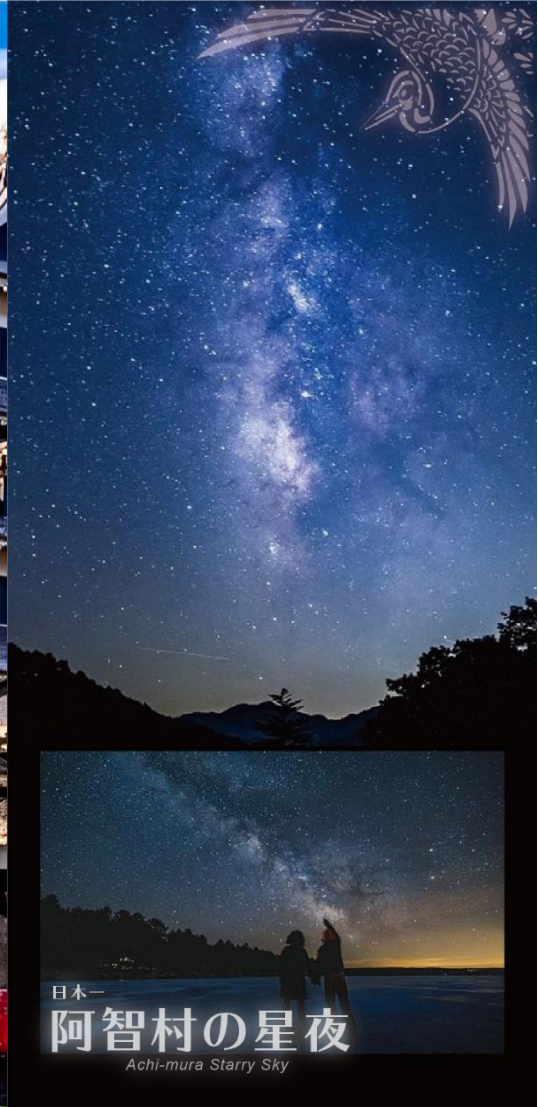
日本一 阿智村の星夜 Achi-mura Starry Sky