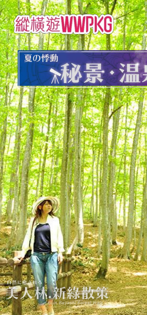
自然に癒される 美人林・新緑散策 Bijin Bayashi Forest Walk