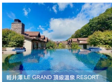
輕井澤 LE GRAND 頂級溫泉 RESORT