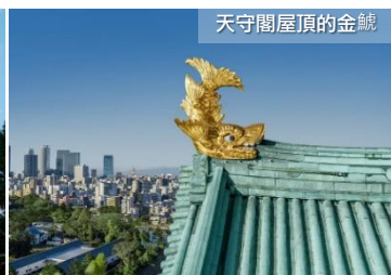
天守閣屋頂的金鯱