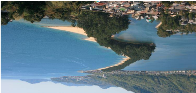
北端：傘松公園展望台 - 「昇龍觀」