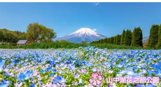
山中湖花之都公園