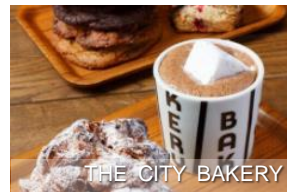
THE CITY BAKERY

在標高 1,289 米的山頂之上，設施的戶外平台是能將北阿爾卑斯山雄偉山景盡收眼底的話題露天咖啡。設施內還有創業於 1990 年來自紐約的老字號麵包店「THE CITY BAKERY」，故能一面享用現烤麵包，一面配著咖啡，享受北阿爾卑斯山一望無際的壯麗絕景。附近有絕景鞦韆(500 日圓/回)，可自行前往參與體驗。