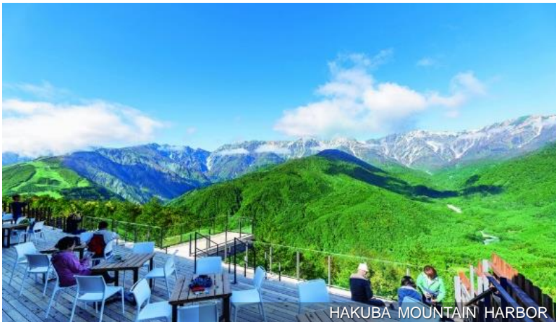
HAKUBA MOUNTAIN HARBOR

在充滿神聖象徵的白馬三山(白馬岳、杓子岳、白馬鑓ヶ岳)正對面，一個名為「HAKUBA MOUNTAIN HARBOR」的綜合商業設施落戶在白馬岩岳之上。