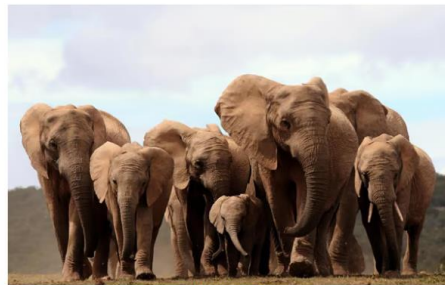
非洲大象 African Elephant

有「萬獸之王」的美譽，是非洲頂級的貓科食肉動物。在非洲獅領域內，所有食肉動物在其面前都處於劣勢，是真正的草原霸主！此動物被列入《世界自然保護聯盟瀕危物種紅色名錄》