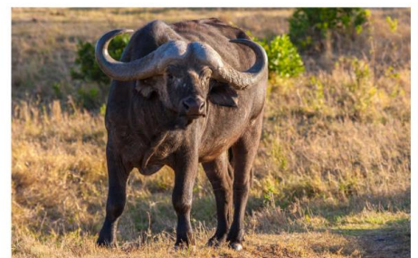
非洲水牛 African Buffalo

成年非洲雄象高於3.5公尺，最高更可達4.1公尺。體重約為4至5噸，最重記錄有7.3噸。在象群中，最老的雌象永遠是領導者。野生非洲象非常兇猛且攻擊性強，比亞洲象更暴躁，是非洲草原上危險的動物。