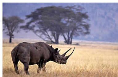
黑犀牛 Black Rhinoceros

非洲豹是豹的亞種之一，主要分佈於非洲，由於面臨棲息地的逐漸喪失和分割的威脅，2008年世界自然保護聯盟將其列入瀕危物種。目前此亞種在保護區以外越來越少見，數量正在不斷減少。