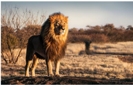
非洲獅子 Panthera leo

非洲五霸是指非洲獅、非洲象、非洲水牛、非洲豹和黑犀牛，是戰利品狩獵中價值最高的五種非洲大型動物。這些動物成為「五霸」是因為徒手捕捉牠們的難度最高，而不是因為牠們的體型龐大。