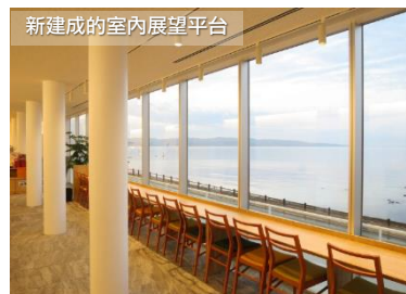
新建成的室內展望平台