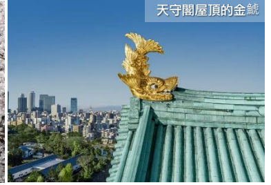
天守閣屋頂的金鯱