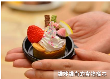
維妙維肖的食物樣本

相信大家有見過日式餐廳的櫥窗放了幾可亂真的食物樣本，賣相吸引，令人食指大動。這些維妙維肖的食物樣本其實是用熱蠟或樹膠製作，經專業人士用巧妙的手工製成。如今日本大多數的食物樣本仍然出自郡上八幡的食物樣本公司的手筆，可謂專業至極。在食物樣本工房內除了可欣賞到不同的食物樣本外， 我們還特意為您安排可以親手製作一份屬於自己的食物樣本！