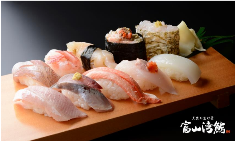
天然の造り 富山湾鮭

富山灣受到大自然恩惠一年四季都捕撈到豐富海鮮的富山灣，再加上打撈地點與漁況十分相近，為鮮度提供了保障。富山壽司的精髓就是「時令海魚」，比方說冬令有紅堪察加擬石蟹、小金槍魚、白蝦、牡丹蝦、加賀螺、鱒魚，請您盡情品嚐富山出產的天然、新鮮的時令海鮮！