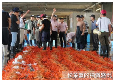
松葉蟹的拍賣盛況

新湊漁港和一般的魚市場於早上拍賣不同，於下午 1 點開始進行午間的拍賣。由於流入富山灣的水都來自庄川峽、小矢部川、白山山系和飛驒山，當中含有多種礦物的礦水也都充分地注入到新湊的海裡。因此新湊的魚介類能夠獲得充分的營養成長。除了能觀摩到拍賣現場外，還能以令人難以置信的價錢享用新鮮的白蝦、松葉蟹、螢光烏賊、鰯魚、貝類等等，蟹類還會有專人填忙拆解。