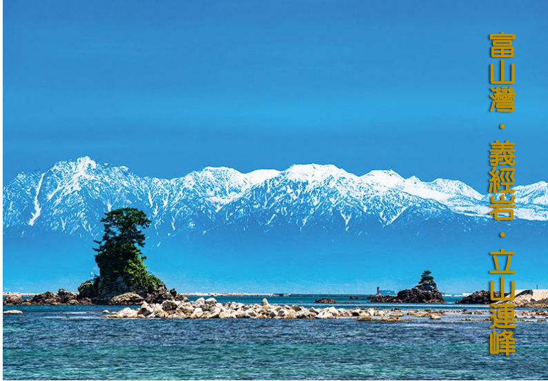
富山灣·義經岩·立山連峰