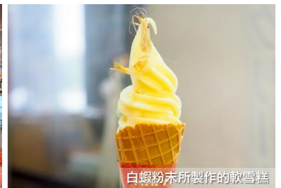
白蝦粉末所製作的軟雪糕