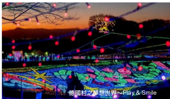
德國村之夢想世界~Play &amp; Smile