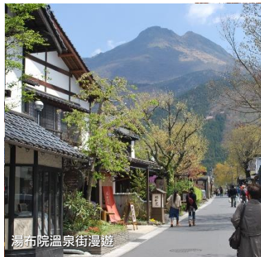
湯布院溫泉街漫遊