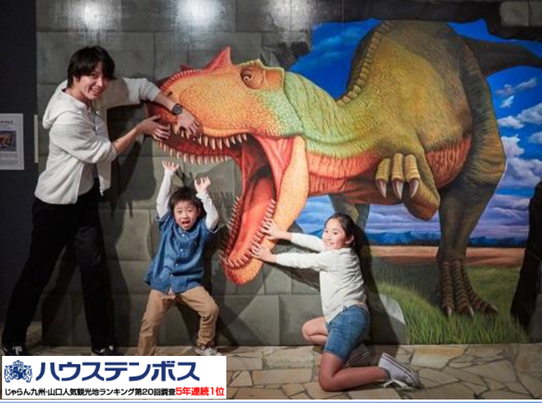
ハウステンボス じゃらん九州・山口人気観光地ランキング第20回調査5年連続1位