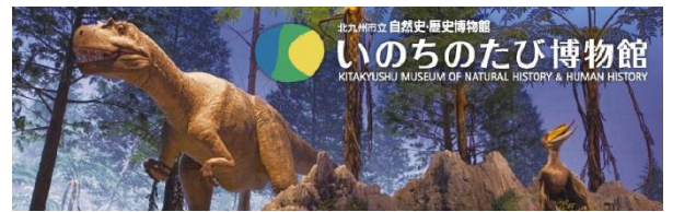
北九州市立自然史・歴史博物館 いのちのたび博物館 KITAKYUSHU MUSEUM OF NATURAL HISTORY & HUMAN HISTORY