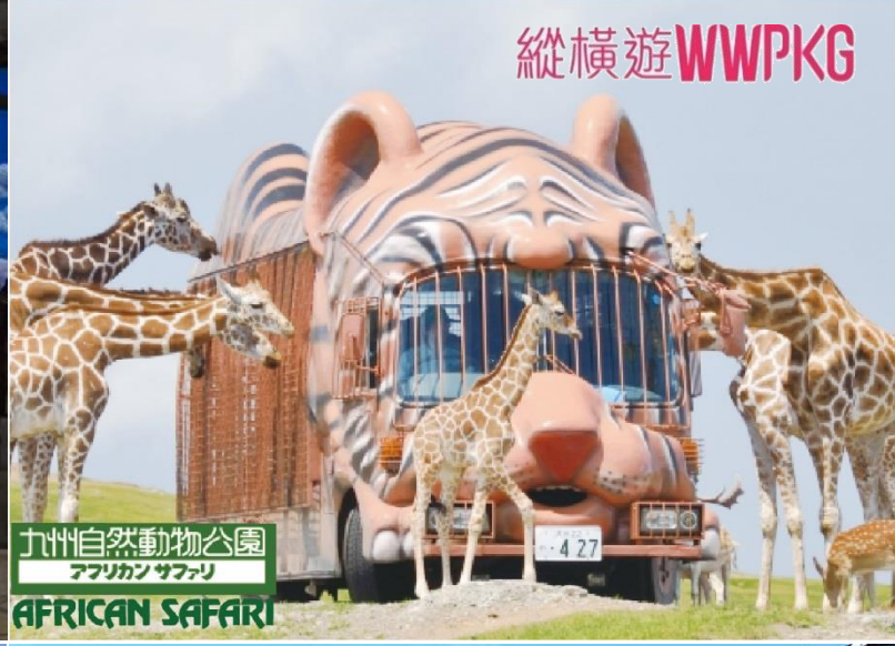
九州自然動物公園 アフリカンサファリ AFRICAN SAFARI