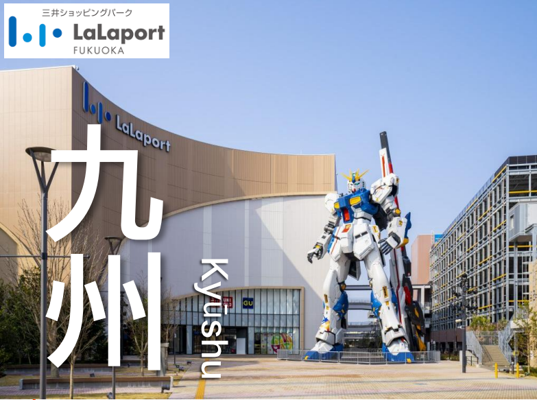
三井ショッピングパーク LaLaport FUKUOKA