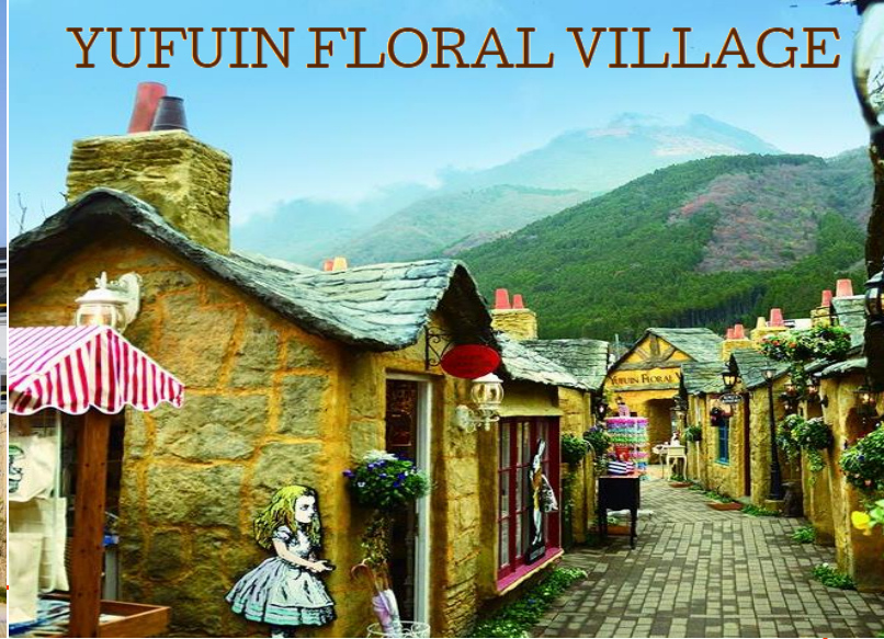
YUFUIN FLORAL VILLAGE