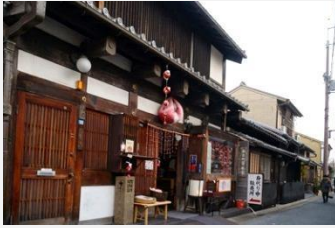
奈良町資料館 可購買此處僅有的奈良土產「替身猿」