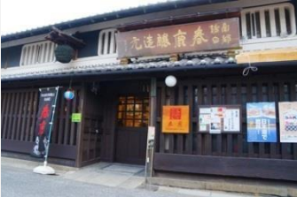
春鹿釀造元 設有日式酒吧的知名日本酒老舖