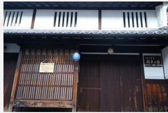
奈良町格子之家 欣賞傳統奈良木造老房子