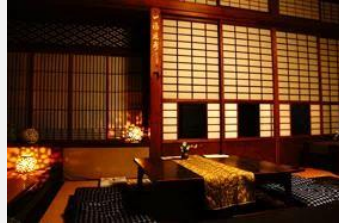
【吉野葛 佐久良】160年歷史町家茶房 其「葛餅」是奈良必吃美食（約780日圓）

「奈良町」是以「元興寺」舊址境內為中心，佔地約 48.3 公頃的歷史老街。於 1300 多年前，奈良町一帶被稱為平城京（當時的京城）。京城遷往京都後，奈良町內的元興寺仍為鎮守國家的重要信仰，奈良町作為寺廟街道持續發展，寫經用的筆墨、僧侶袈裟用的晒（布料）、日常生活的蚊帳、棉被、刀、酒、醬油等各種產業蓬勃發展。江戶時代中期，奈良町是關西人和九州人前往伊勢神宮途中熱鬧的街道。到了明治～昭和時代，奈良町成為整個奈良的商業中心。