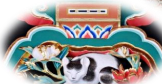
3) 奧宮入口 「眠貓」