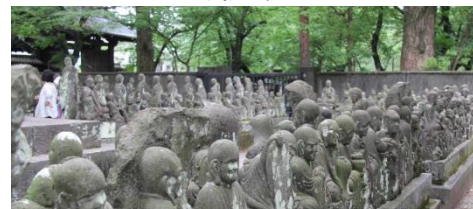
540 尊羅漢列陣 喜多院