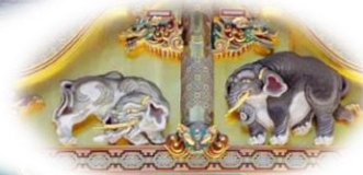
2) 上神庫 「想像之象」