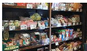
「香味風景百選」菓子屋橫丁