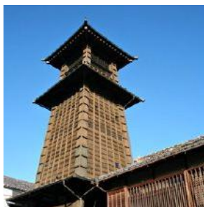
「日本的音風景 100 選」 川越鐘樓 動聽的鐘聲

川越小江戶以完整保留日本江戶時期古老歷史、傳統文化、許多文化遺產聞名。日本江戶時期以青磚瓦片製造的倉庫群及被指定為文化財的古老住宅等古老風味的建築並排街道兩側為首，世代相傳的百年老店及日式甜點商店等林立，四處都充滿著古舊情懷。除此之外還可以參觀建於 1457 年的「川越城」以及具有歷史的寺院、博物館、美術館，可以感受到濃厚的文化氣息。川越城、江戶城及岩槻城同在幕府時期建造的關東三城之一，曾經發展至 17 萬石之城鎮。川越在日本江戶時期為河運中心，建築受江戶風格影響最深，因此又名「小江戶」。