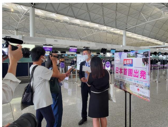
CN 接受傳媒朋友訪問