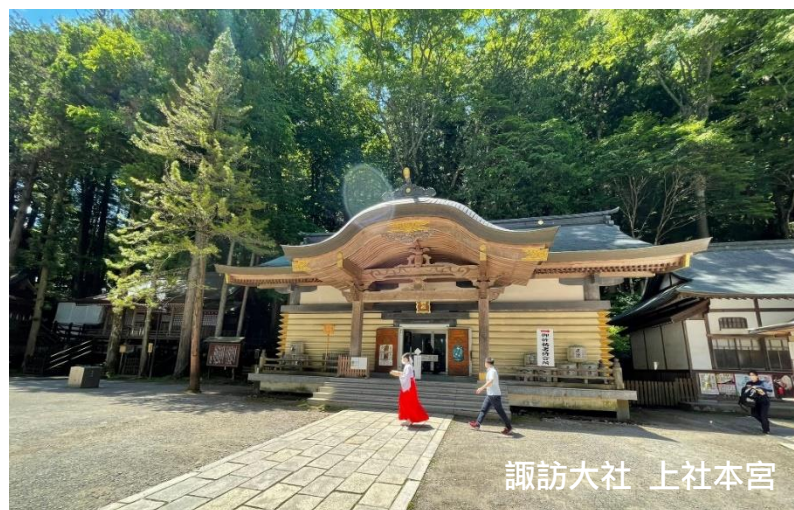
諏訪大社 上社本宮