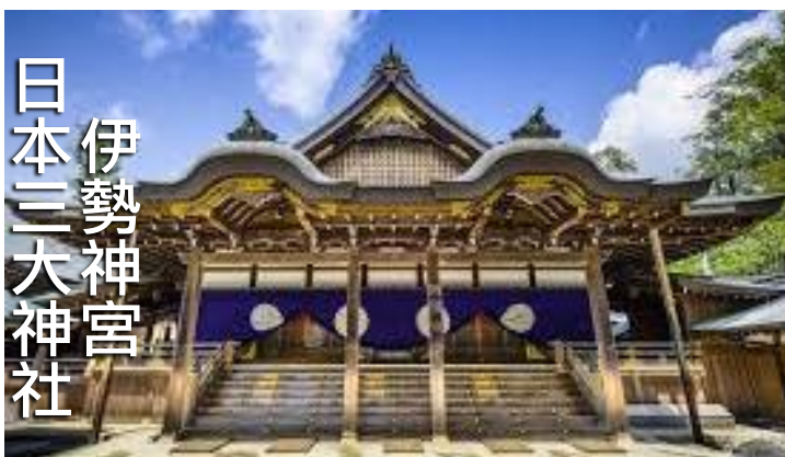
日本三大神社 伊勢神宮

伊勢神宮在日本是最重要的神社之一，和京都的平安神宮、東京的明治神宮並列為日本三大神宮，每年估計超過 6 百萬人前來參拜與參觀。因為伊勢神宮內供奉的是日本神話裡代表 太陽的天照大神，太陽對日本人來說意義非凡，因此日本人對伊勢神宮有特別的崇拜，亦是日本人心中的全國神社代表！伊勢神宮更被日本首相安倍晉三選為 2016《G7 峰會》迎接各國首腦之地點，因伊勢神宮極具代表性，盼各位首腦參觀伊勢神宮了解日本文化！