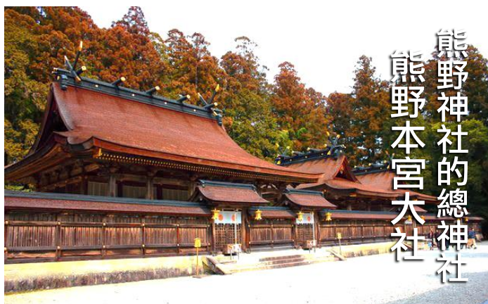
熊野神社的總神社 熊野本宮大社

自 14 世紀起，在當地老百姓的生活中就形成了參拜熊野的習慣，當時有“螞蟻參拜熊野”的說法，由此可見參拜人數之多。綠茵叢中鋪有青苔石階的熊野古道邊上有描述參拜歷史的古迹和石碑，許多人喜歡將熊野古道作為散步線路。