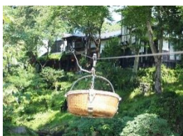
店員正在回收竹籃...