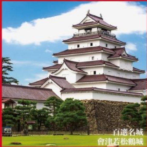
百選名城 會津若松鶴城