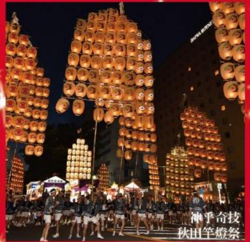
神乎奇技 秋田竿燈祭