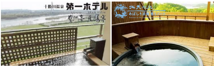
十勝川溫泉 第一ホテル