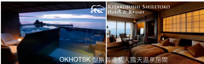
OKHOTSK 型格海邊私人露天溫泉房間