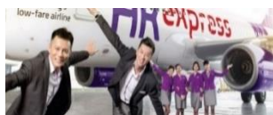
每人包運送 20kg 行李