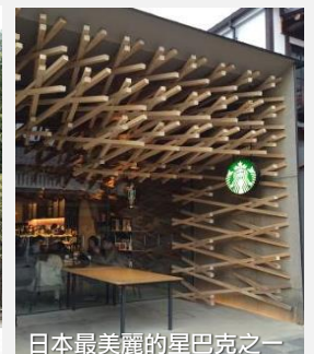
日本最美麗的星巴克之一