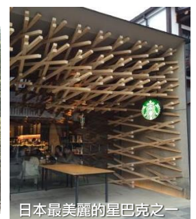
日本最美麗的星巴克之一