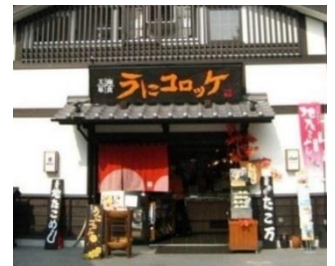
(吉列海膽餅的店舖:天草海食まるけん)