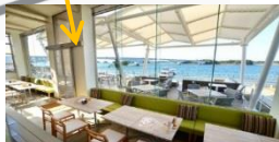
Plate cafe L'isola