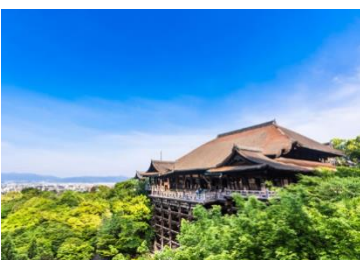
依附錦雲溪懸崖峭壁而建的「舞台」

嵐山是一處遠離商業繁囂，仍保有自然美景，一年四季風景宜人的地方，渡月橋跨越嵐山腳下流過的保津川。可自由前往竹林小路感受被兩旁宏偉的竹林所散發出的幽靜氣息，2015 年獲美國 CNN 選入日本 31 景之一。另外，亦可散步到世界文化遺產的天龍寺外苑感受嵐山的靈氣與古韻風情。