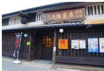
春鹿釀造元 設有日式酒吧的知名日本酒老舖