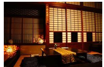
【吉野葛 佐久良】160 年歷史町家茶房其「葛餅」是奈良必吃美食（約 780 日圓）