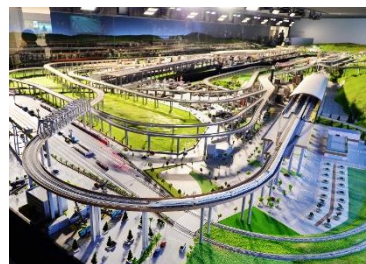
規模龐大的實景模型