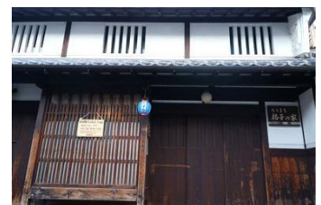
奈良町格子之家 欣賞傳統奈良木造老房子