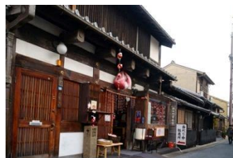
奈良町資料館 可購買此處僅有的奈良土產「替身猿」

從信仰中心的寺廟街道到商業街道，在歷史悠悠流轉後，昔日寺廟街道保留下來成了今日古樸而厚實的「奈良町」。街上有許多耐人尋味的老招牌、江戶時代的老房改建而成的古風的傳統工藝精品店、茶屋等，這些木造的建築、美觀的白壁與方格排屋式民房，體現出純樸的古街道優雅風情。