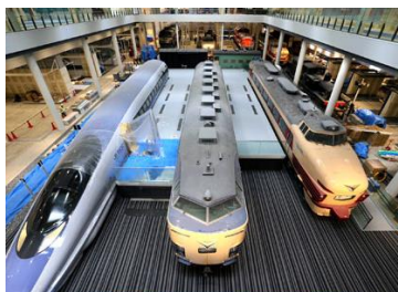
各種形號火車陳列