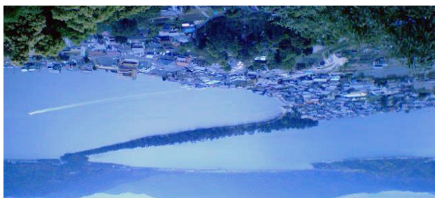
1) 北端：傘松公園展望台 - 「昇龍觀」