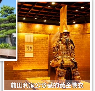
前田利家公珍藏的黃金戰衣