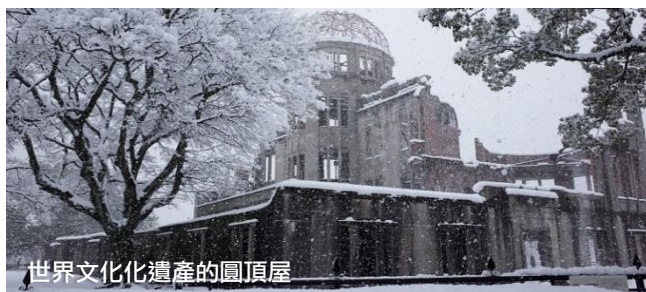
世界文化遺產的圓頂屋

廣島是世上第一個原子彈爆炸地，和平公園就建在當時原爆中奇迹留下，及後入選為世界文化遺產的圓頂屋旁，是祈求世界和平所建的市民公園。附近的廣島原爆資料館則收藏著眾多展品都能讓您加深對這段歷史的認識如原子彈爆炸受害者的遺物，例如衣物、眼鏡、頭髮。以及原爆對建築物及人體所造成之慘狀的照片和資料等。