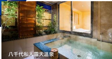
八千代私人露天溫泉