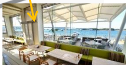
Plate cafe L'isola