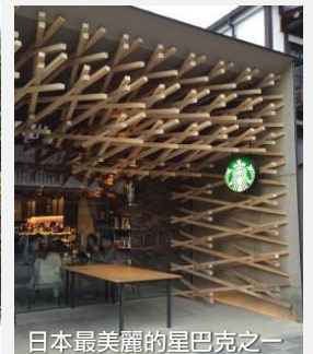
日本最美麗的星巴克之一