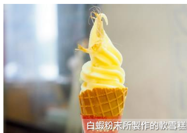
白蝦粉末所製作的軟雪糕