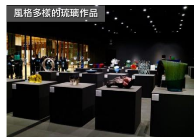
風格多樣的琉璃作品