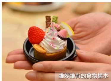
維妙維肖的食物樣本

相信大家有見過日式餐廳的櫥窗放了幾可亂真的食物樣本，賣相吸引，令人食指大動。這些維妙維肖的食物樣本其實是用熱蠟或樹膠製作，經專業人士用巧妙的手工製成。如今日本大多數的食物樣本仍然出自郡上八幡的食物樣本公司的手筆，可謂專業至極。在食物樣本工房內除了可欣賞到不同的食物樣本外， 我們還特意為您安排可以親手製作一份屬於自己的食物樣本！