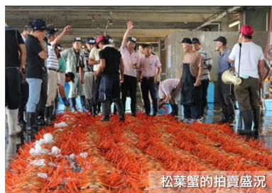
松葉蟹的拍賣盛況

新湊漁港和一般的魚市場於早上拍賣不同，於下午 1 點開始進行午間的拍賣。由於流入富山灣的水都來自庄川峽、小矢部川、白山山系和飛驒山，當中含有多種礦物的礦水也都充分地注入到新湊的海裡。因此新湊的魚介類能夠獲得充分的營養成長。除了能觀摩到拍賣現場外，還能以令人難以置信的價錢享用新鮮的白蝦、松葉蟹、螢光烏賊、鰯魚、貝類等等，蟹類還會有專人填忙拆解。