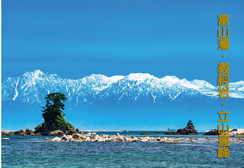
富山灣・義經岩・立山連峰