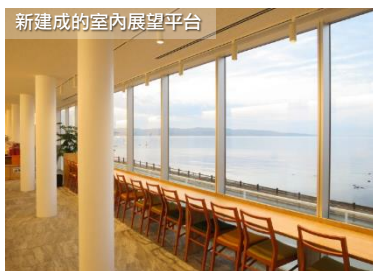
新建成の室內展望平台