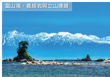
富山灣・義經岩與立山連峰