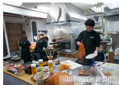
用熱蠟或樹膠製作