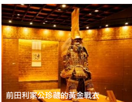
前田利家公珍藏的黃金戰衣