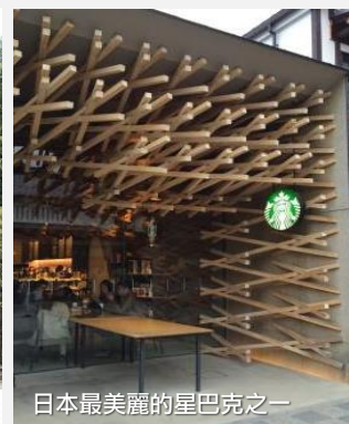
日本最美麗的星巴克之一