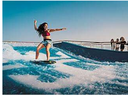
甲板衝浪®+甲板跳傘