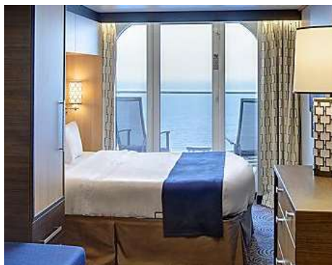
海景露台房 Oceanview Balcony