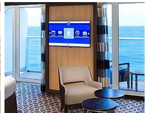
標準套房 Junior Suite