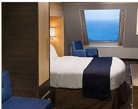
海景房 Oceanview Stateroom