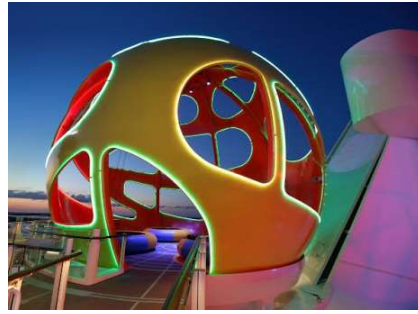
南極球 Skypad *新登場