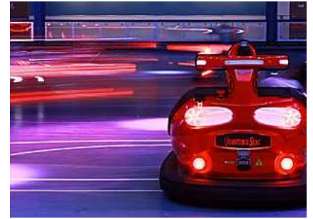
海上多功能運動場 (SEAPLEX®)