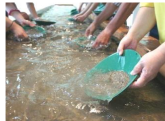
西三川黃金公園淘金體驗